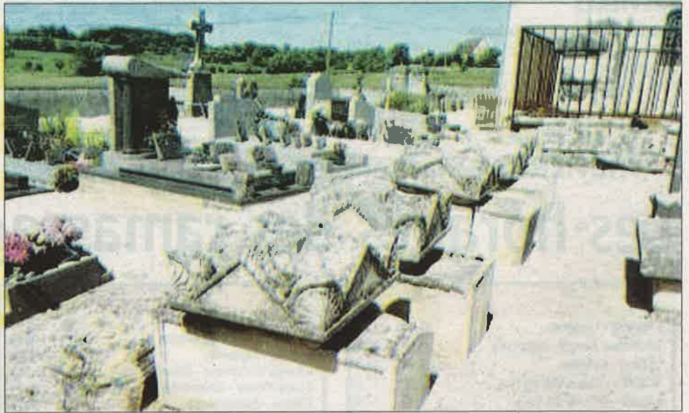
A l'issue de leur réunion, les membres de l'association se sont retrouvés au cimetière d'Aignerville, à la demande de la présidente de l'APPA (Association Passé Patrimoine d'Aignerville).